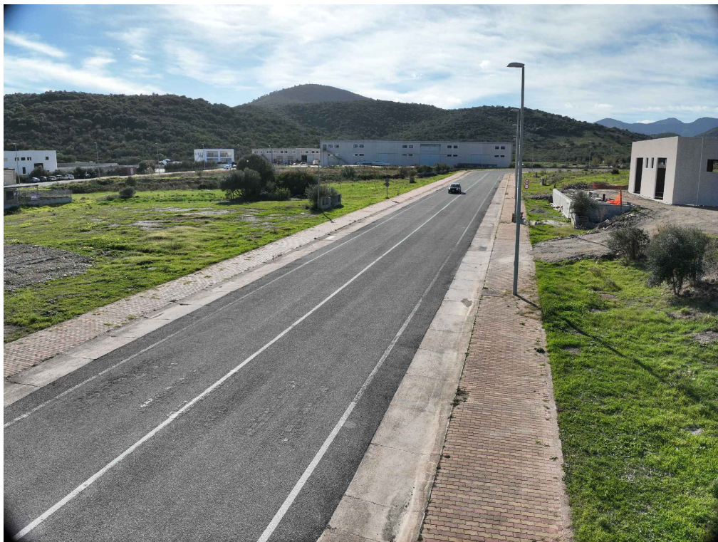
03 - Inquadratura telecamera