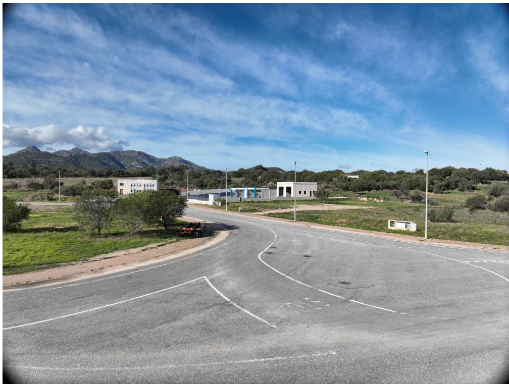
01 - Inquadratura telecamera