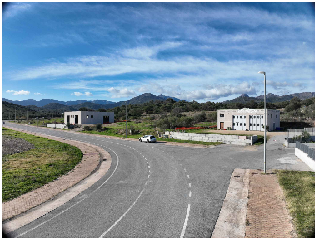
02 - Inquadratura telecamera